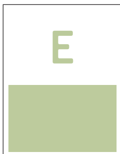
Anzeigenformat E – 1/2 Seite – 182 x 120 mm € 1.058,00