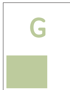
Anzeigenformat G 89 x 100 mm € 588,00