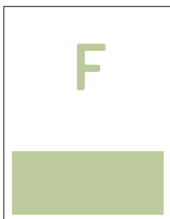
Anzeigenformat F 182 x 78 mm € 688,00