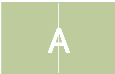
Anzeigenformat A – Doppelseite – 420 x 280 mm zzgl. 3 mm Beschnitt (randabfallend) € 4.939,00