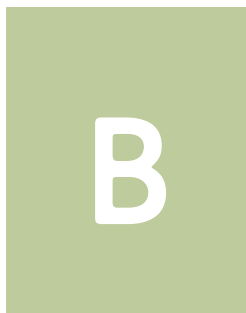
Anzeigenformat B – 1 Seite – 210 x 280 mm zzgl. 3 mm Beschnitt (randabfallend) € 2.470,00