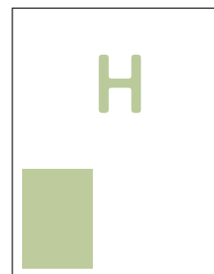
Anzeigenformat H 58 x 100 mm € 294,00