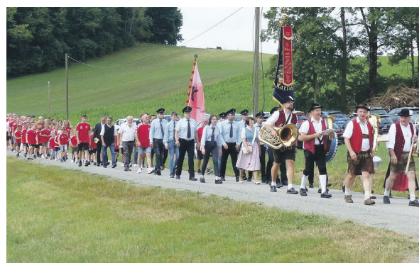
Zum Vereinsjubiläum gab es einen stattlichen Festzug.

Sportverein sein großes Festzelt zur Verfügung stellte. Die engagierten Musiker spielten allesamt ohne Gage, sodass das Eintrittsgeld von zehn Euro in vollem Umfang der „Lebenshilfe für behinderte Menschen“ in den Landkreisen Freyung-Grafenau und Passau zugutekommt. Das Konzert fand großen Anklang, es wurde viel getanzt, geschunkelt und mitgesungen. fd