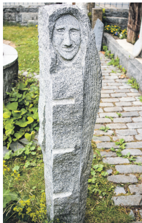
Der Stein bekam ein Gesicht.

In seinem Buch „durch `s Joahr und durch `s Lebma“ findet der interessierte Leser viele seiner Gedichte, oder besser gesagt Gedankensplitter, wieder. Selbst die Zeichnungen im Buch stammen von ihm. Letztere präsentieren eine weite-