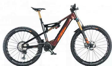
KTM MACINA KAPOHO PRESTIGE

Hochwegen 3 - 94112 Fürsteneck Tel. 08555 / 237 - www.bauer-hochwegen.de