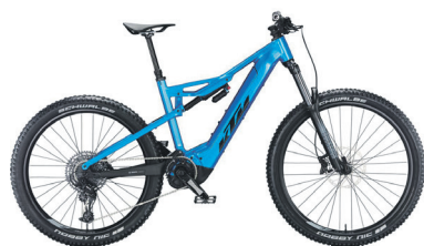
KTM MACINA KAPOHO 7973