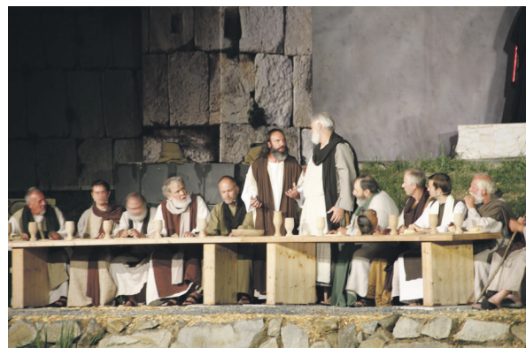
Die Perlesreuter Passionsspiele finden alle vier Jahre statt. Heuer im August ist es wieder soweit - ein Erlebnis, das man live gesehen haben muss!

Die Passionsspiele finden am 4., 5., 6., 11., 12., 13. und 14. August, jeweils ab 20.30 Uhr statt. Karten sind im Vorverkauf zum Preis von 25 Euro, an der Abendkasse für 27 Euro erhältlich (Jugendliche bis 14 Jahre: VVK 17 Euro; Abendkasse 19 Euro). Vorverkauf online unter www.okticket.de . Weitere Informationen zu den Passionsspielen finden Sie unter www.passionsspiele-perlesreut.de .