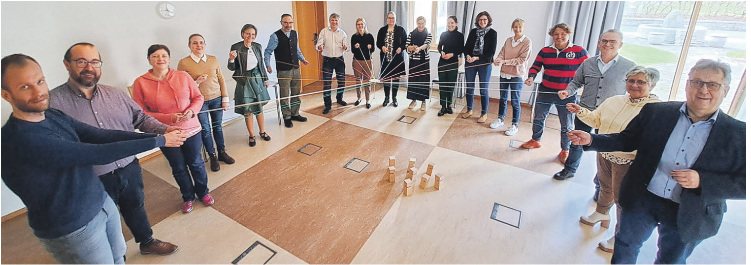
Wie die Caritas Vorstände und Abteilungsleiter*innen hier auf dem Bild, sollen die angehenden Führungskräfte lernen, miteinander die Herausforderungen zu meistern.

Caritas Passau setzt auf eine ethikbewusste Führungskultur